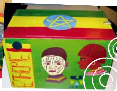
Met een leskist wordt een presentatie nóg leuker.